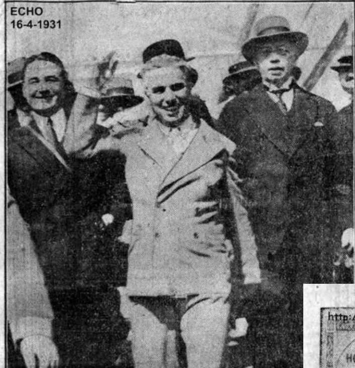
L'ARRIVÉE DE CHARLI CHAPLIN A ALGER