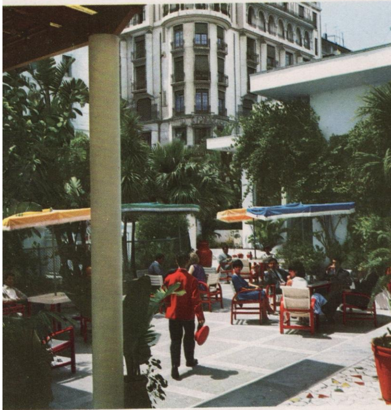
Le Bar Cintra avec son jardin: lieu de rendez-vous de la «haute».