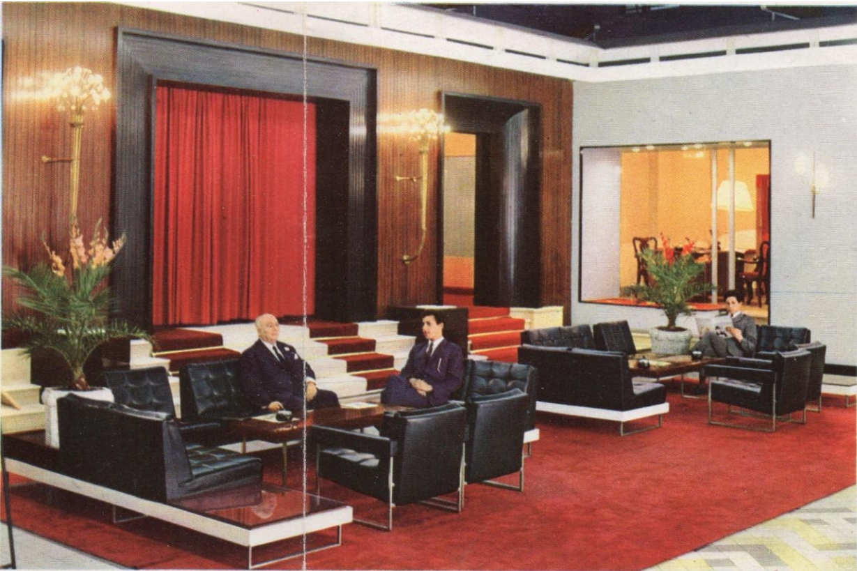
La Hall de l'Hotel.

La terrasse Roof au premier étage de l'Hotel, d'où l'on peut jouir d'une ravissante vue sur la mer.