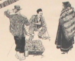
EXTRAITS DE "LES PAYS D'ALGER", PEINTS DE HENRI KLEISS AVEC UN